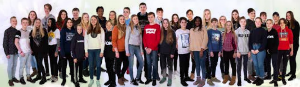
AUSTRHEIM OG FEDJE KONFIRMANTANE 2019

De har alltid ein plass i Austrheimkyrkja!